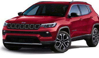
Limited: Colorado Red