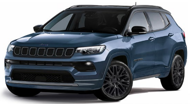
Model S: Blue Shade + Sort tak