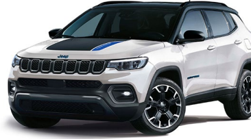
Trailhawk: Alpine White + Sort tak