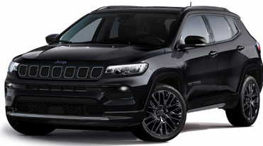
Model S: Solid Black