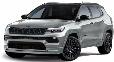
Model S: Glacier + Sort Tak