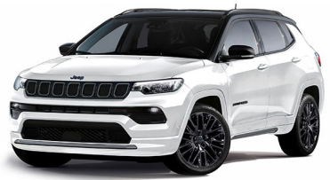
Model S: Alpine White + Sort tak