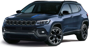
Trailhawk: Blue Shade + Sort tak