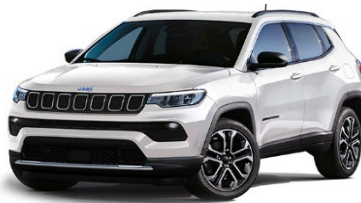
Limited: Alpine White