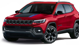
Trailhawk: Colorado Red