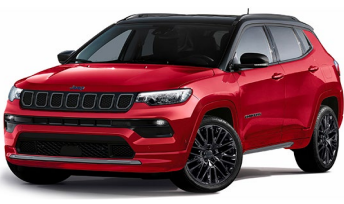
Model S: Colorado Red + Sort Tak