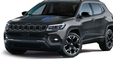
Trailhawk: Graphite Grey